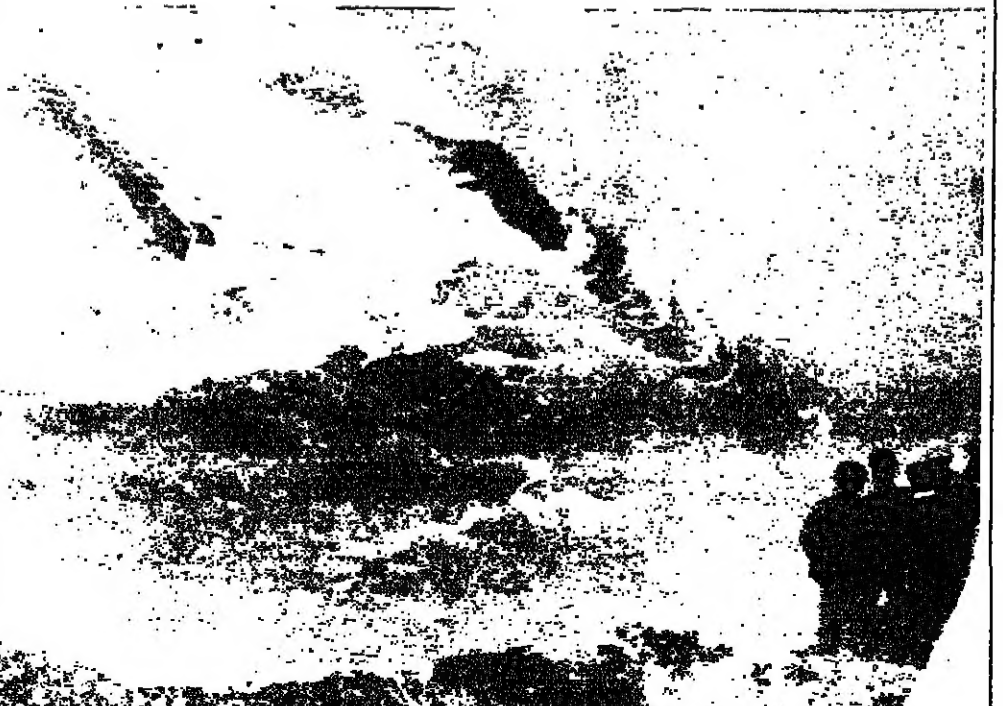
الامواج العاتية تلمح حطام سفينة الشحن التجريبية، «ريفر غورارا»، بعد غرقها على بعد ٤٠ ميلاً الى الجنوب من ليشبون على الساحل البرتغالي وكان انقذ ٢٨ شخصاً من طاقمها بينما بقي مصرع ١١ مجبرولا وتوفي ٧.